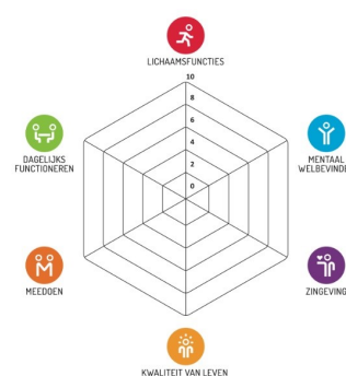
Spinnenweb met de zes gebieden van positief gezond